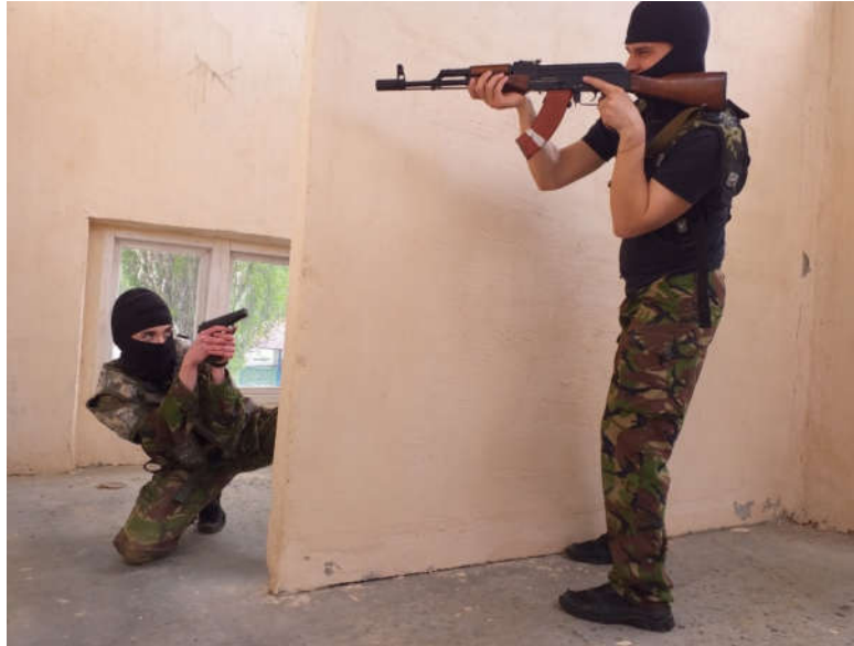
Рисунок 1. Використання лазертагу на заняттях з тактичної підготовки у приміщенні

Лазертаг поділяється на два види: інтегрований та неінтегрований. В інтегрованому варіанті використовується зброя, в середині якої розташована електронна частина. В неінтегрованому варіанті використовується справжня вогнепальна зброя для відстрілу холостих набоїв. На цій зброї у передній частині встановлюється електронний пульт, який забезпечує появу інфрачервоного променя під час стрільби.