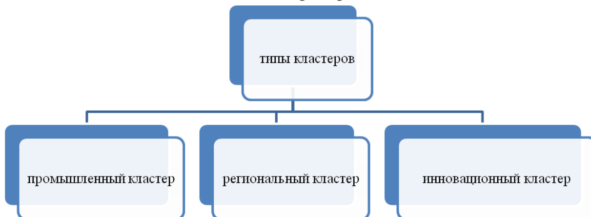
Рисунок 2 – Типы кластеров в научной литературе

Инновационный кластер – это целенаправленно сформированная группа предприятий, функционирующих на базе центров генерации научных знаний и бизнес-идей, подготовки высококвалифицированных специалистов.