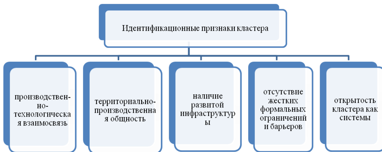
Рисунок 3 – Идентификационные признаки кластера

Идентификационные признаки кластера представим на рисунке 3.